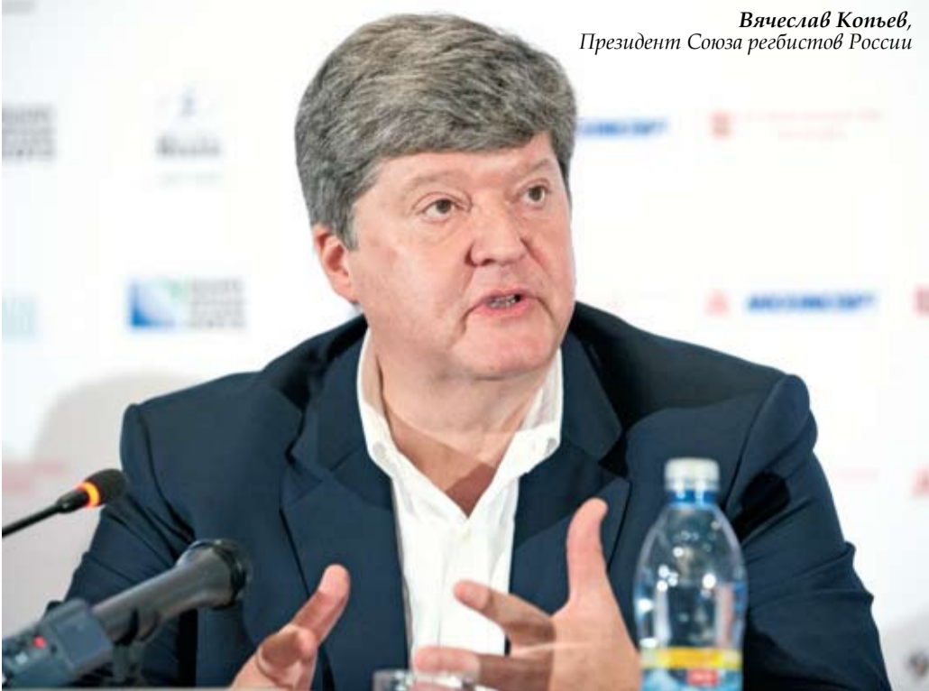
Вячеслав Копьев, Президент Союза регбистов России