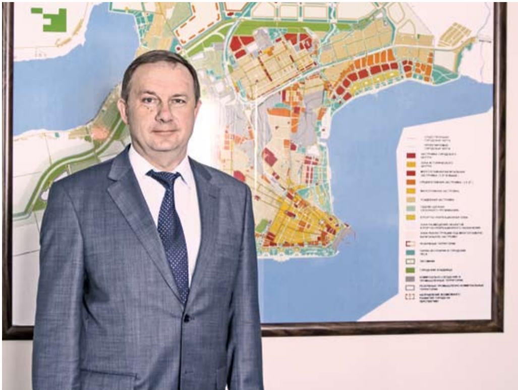
Владимир Прасолов: «У нашего города большой научный, промышленный, культурный и туристический потенциал. Нужно мудро распорядиться этим бесценным капиталом и приумножить его»